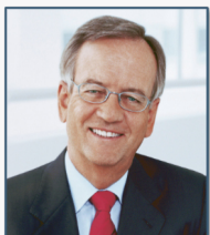
Prof. Dr. Heinrich von Pierer

um auch in Krisenzeiten wieder etwas ruhiger zu schlafen: EIM und unsere Manager profitieren zusätzlich von dem Erfahrungsschatz dieser Business Leader mit Restrukturierungsexpertise, um schnell die notwendige Lösung für Ihr Unternehmen zu finden.